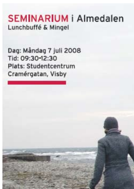
Bild från flyer om seminariet i Almedalen den 7 juli.