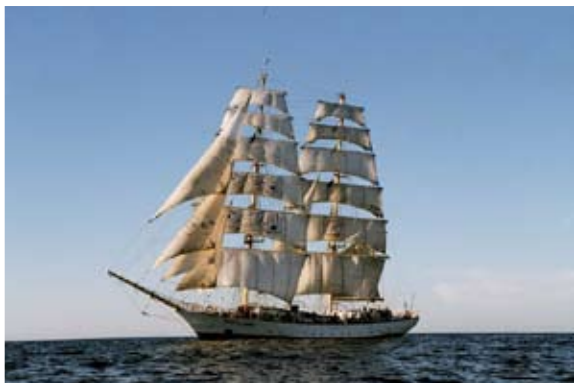
På bilden syns segelfartyget STS Fryderyk Chopin där Erasmus IP-projektet S.A.I.L. genomförs under segling i Östersjön.

De svenska intensivprogram som beviljats i år får nästan dubbelt så stor budget att dela på jämfört med tidigare. I siffror betyder det drygt 423 000 euro, mot 268 000 euro förra året.