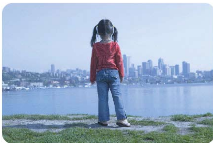
Klimatförändringen blir en konkret ingång till hela Den Globala Skolans uppdrag.