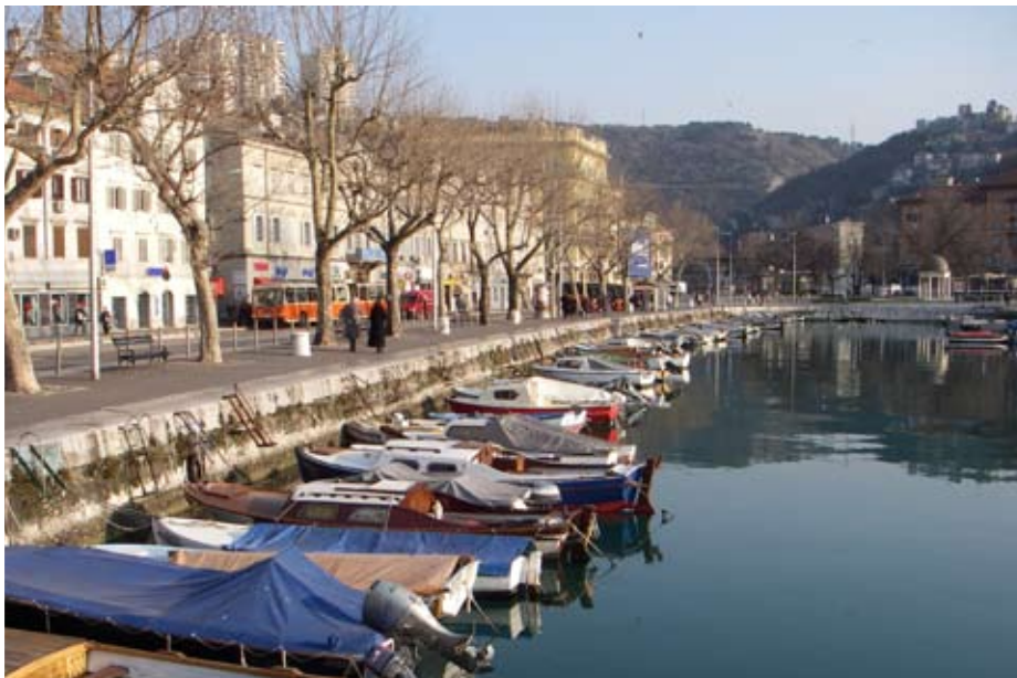
Lärosäten i Kroatien förbereder sig för att kunna delta i Erasmusprogrammet. Här en bild från Rijeka, Kroatien.

Jari Rusanen: jari.rusanen@programkontoret.se, tfn 08-453 72 42