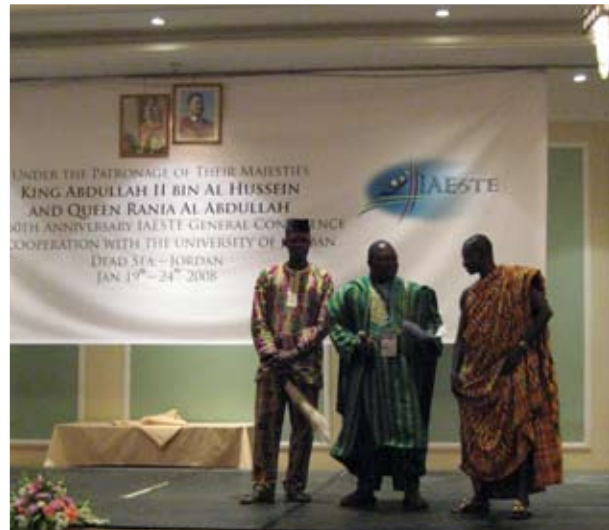
Under IAESTES årsmöte skapas praktikmöjligheter för teknikstuderande genom att deltagande länder byter praktikplatser med varandra. Här en delegation från de afrikanska länderna.

Carola Barhammar, carola.barhammar@programkontoret.se