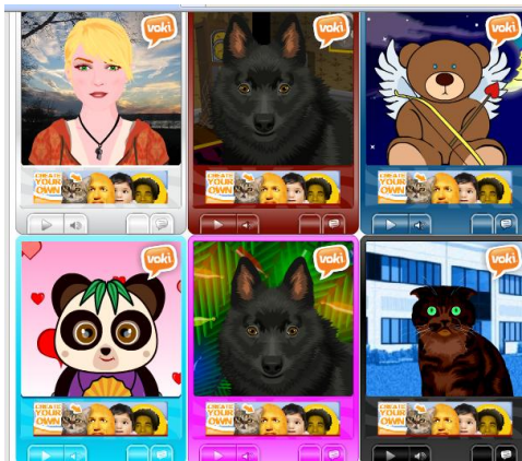
Elevernas fina Vokis, avatrar med elevernas egna röster!